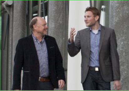
Eine starke Familie seit 1878.

... ist seit vielen Jahren das führende Unternehmen im Bereich der Gebäudehülle „dach+fassade“ in der Region Oberschwaben. Das bereits in fünfter Generation erfolgreiche Familienunternehmen mit mehr als 125 Mitarbeitern legt besonderen Wert auf kundenorientierten Service, beste Qualität und Nachhaltigkeit. Dabei wird das Leistungsspektrum kontinuierlich sinnvoll erweitert.